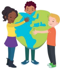
We hebben hart voor elkaar