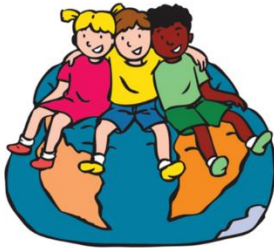
We horen bij elkaar

Het eerste blok van De Vreedzame school gaat over Wij horen bij elkaar