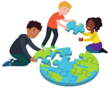
We dragen allemaal een steentje bij

Na de vakantie zullen we starten met blok 5 over: We dragen allemaal ons steentje bij