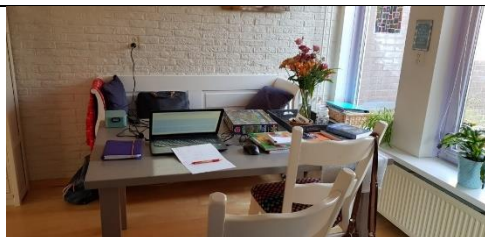
Juf Yda werkt ook aan de keukentafel.