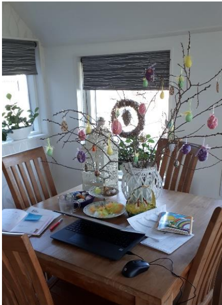
Juf Janneke zit gezellig tussen de paaseieren.